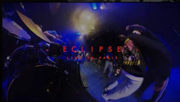
Krav Boca - Eclipse (live, Paris)