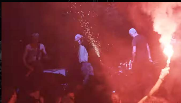
Krav Boca - Pirate Party (live, Athens)