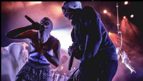
Full multicam live @ Le Metronum, Toulouse

« Les live Krav Boca sont vraiment spectaculaires : puissance musicale, énergie physique, générosité avec le public, tout y est... » meglidiniente.com