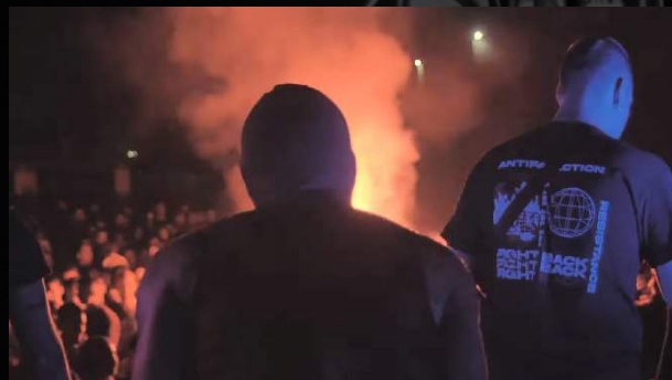
Krav Boca - Vertigo (live, Athens)